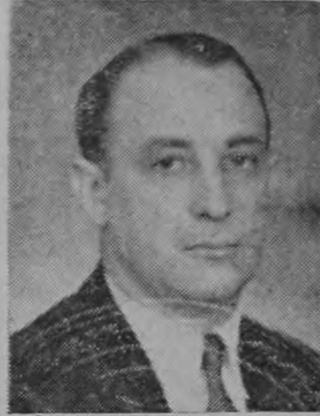
Don Francisco Orlich Ministro de Obras Públicas

Deportistas de Heredia agasajarán al Excmo. Sr. Don Francisco Orlich, Ministro de Obras Públicas